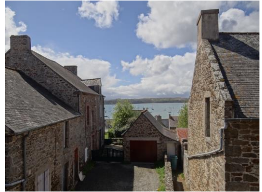
SAINT SULIAC (sur La Rance)